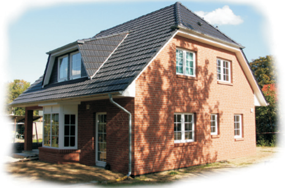
Abb. mit Sonderbauteilen