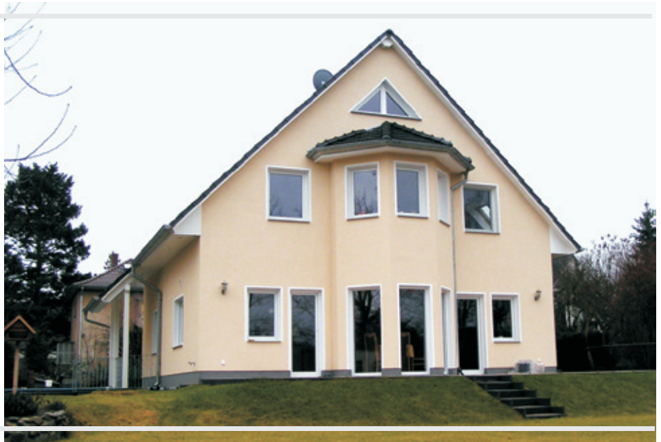
Abb. mit Sonderbauteilen