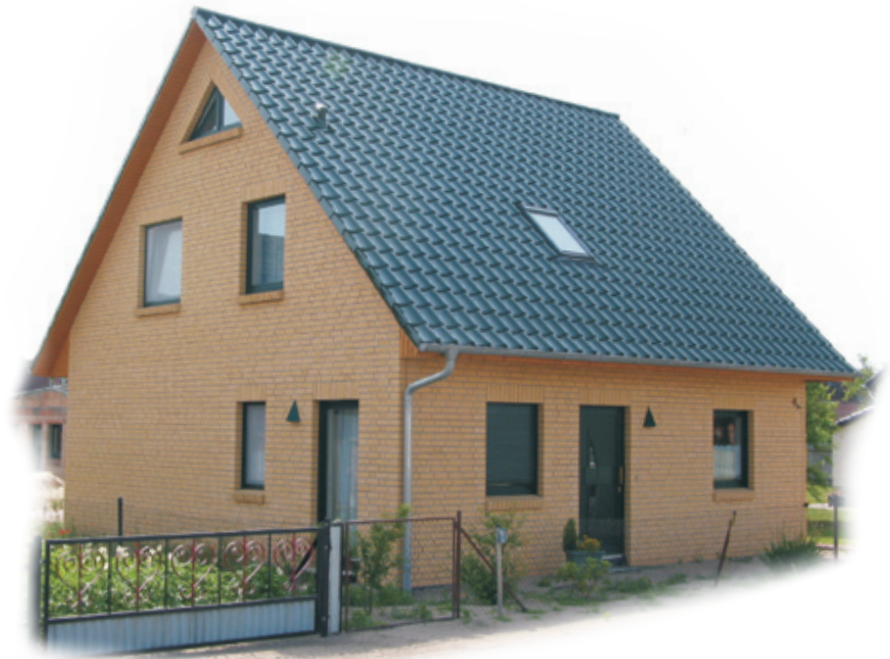
Abb. mit Sonderbauteilen