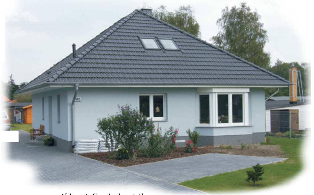
Abb. mit Sonderbauteilen

Bungalow "Rosenau" 87 qm Wohnfläche • OG-ausbaufähig